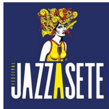
Jazz à Sète 2018

Composés et arrangés par Thierry Balin les neuf titres de « Résilience » explorent le jazz et les musiques du monde où le compositeur puise son inspiration (tango, boléro, biguine, samba, baião, ...). Le groupe présente une musique aux couleurs à la fois festives et mélancoliques.